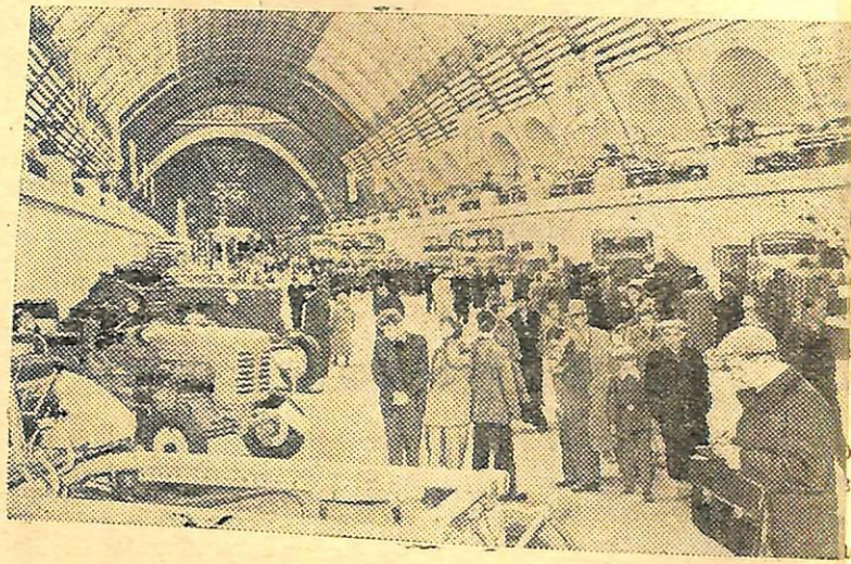
Москва. Всесоюзные сельскохозяйственная и промышленная выставки 1957 года.

В связи с проведением в Москве Всемирного фестиваля молодежи и студентов установлены новые сроки проведения вступительных экзаменов в московские вузы: для проживающих в Москве—с 1 по 15 августа для остальных поступающих—с 16 по 29 августа; зачисление в вузы Москвы будет проводиться с 30—31 августа, начало занятий—со 2 сентября. В других городах экзамены проводятся с 1 по 20 августа, зачисление—с 21 по 25 августа.